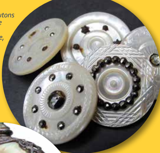
Ensemble de boutons en nacre blanche gravés à queue métallique, début XX e siècle