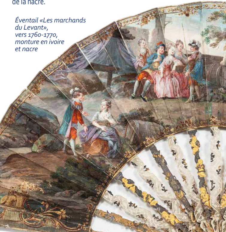
Éventail «Les marchands du Levant», vers 1760-1770, monture en ivoire et nacre

Accompagné d'un guide, découvrez les secrets de fabrication des boutons en nacre et d'un jeu de dominos traditionnel en os et bois d'ébène. Dans nos ateliers reconstitués, comme à l'usine, le guide actionne la machine à vapeur centenaire et reproduit les gestes des tabletiers.