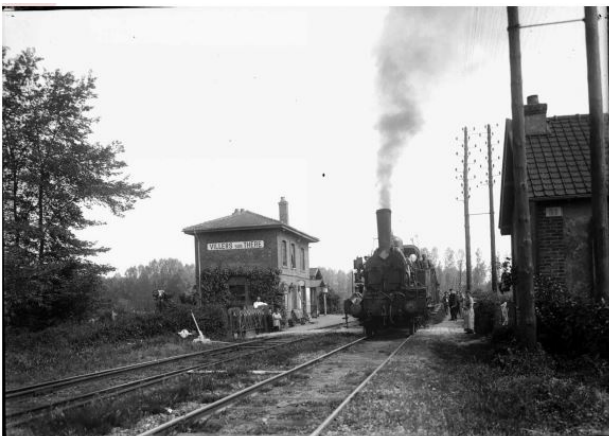
Train en gare de Villers-sur-Thère 1890-1914