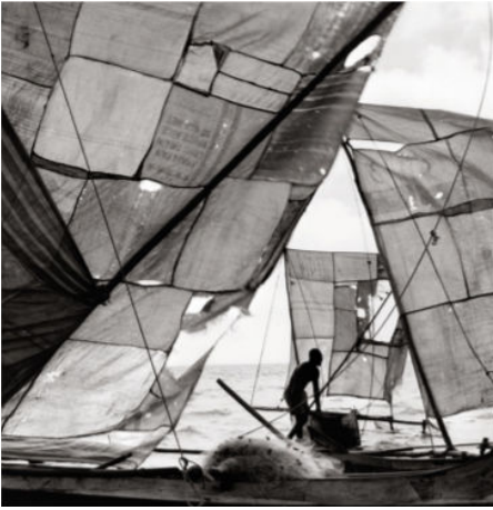
Pêcheur, vers Tulear, Madagascar 2009