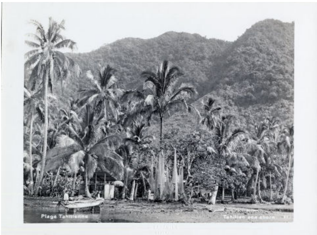
Plage tahitienne Lucien Gauthier Musée de Tahiti et des Iles Te Fare Manaha H. 18 x L. 24 cm