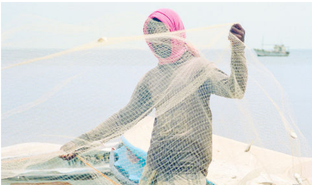
A myth of two souls - Looking For Love, Mannar, Sri Lanka, 2018