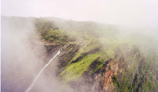
A myth of two souls - First Rains, Jog Falls, Karnataka, Inde