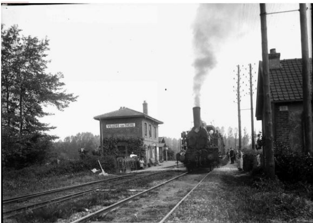
Train en gare de Villers-sur-Thère 1890-1914