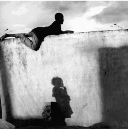
Fianarantsoa, le stade, Madagascar 2000