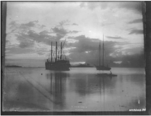
Papeete - goélettes dans la rade Lucien Gauthier Service du Patrimoine Archivistique et Audiovisuel de la Polynésie Française H. 18 x L. 24 cm