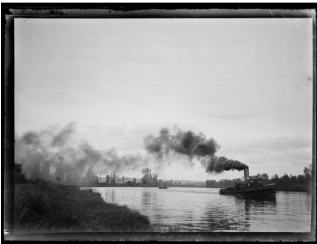
La Seine à Saint-Pierre-du-Vauvray 1899 Paul Faugas Musée de Louviers H. 30,5 x L. 40 cm