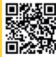
vidéo de présentation

Musée de la Nacre et de la Tablettterie 51, rue Roger Salengro 60110 Méru 03 44 22 61 74 contact@musee-nacre.fr www.musee-nacre.fr