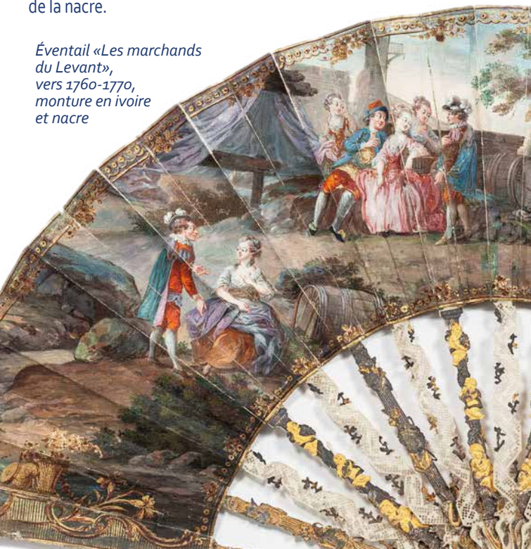
Éventail «Les marchands du Levant», vers 1760-1770, monture en ivoire et nacre

Accompagné d'un guide, découvrez les secrets de fabrication des boutons en nacre et d'un jeu de dominos traditionnel en os et bois d'ébène. Dans nos ateliers reconstitués, comme à l'usine, le guide actionne la machine à vapeur centenaire et reproduit les gestes des tabletiers.