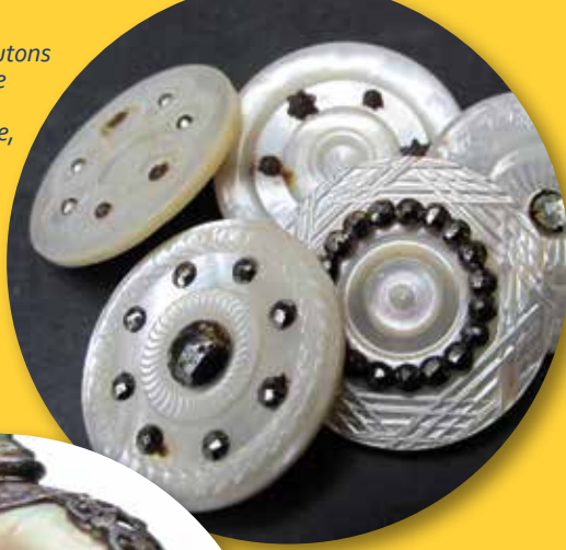
Ensemble de boutons en nacre blanche gravés à queue métallique, début XX e siècle