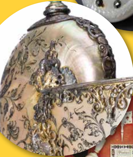
Nautille monté, vers 1890, vermeil, argent et nautille